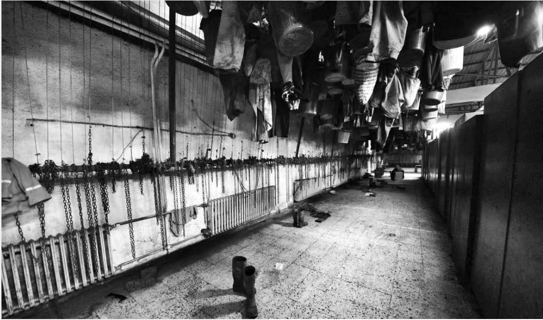
Soma maden işletmesinde madencilerin soyunma odaları. Soma, 2014.

“yeraltı madenlerimizin gerçek sahibi halkımızdır”